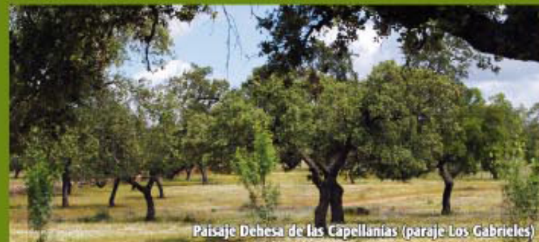
Paisaje Dehesa de las Capellanías (paraje Los Gabrieles)

Llegamos a una nueva bifurcación que tomamos a la derecha, continuando