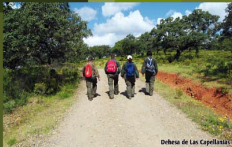
Dehesa de Las Capellanías

SALIDA: Monumento «La Charca» (Barriada del Rollo)