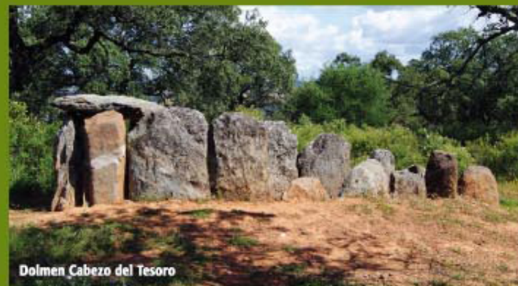
Dolmen Cabezo del Tesoro

Continuando por el camino, en la primera bifurcación que nos encontramos,