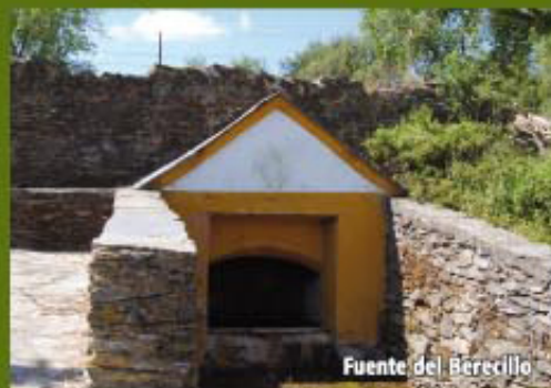
Fuente del Bercillo

Salimos del Pueblo por la calle Concordia, dirección Este y llegando a un ancho callejón inicialmente asfaltado que nos conducirá a la carretera Comarcal H-511 de Valverde del Camino – La Palma del Condado.