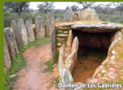
Dolmen de Los Gabrieles

Regresando por el mismo camino, se observa a la derecha una loma entre encinas y jaras donde encontramos el dolmen Cabezo del Tesoro, el mejor conservado.