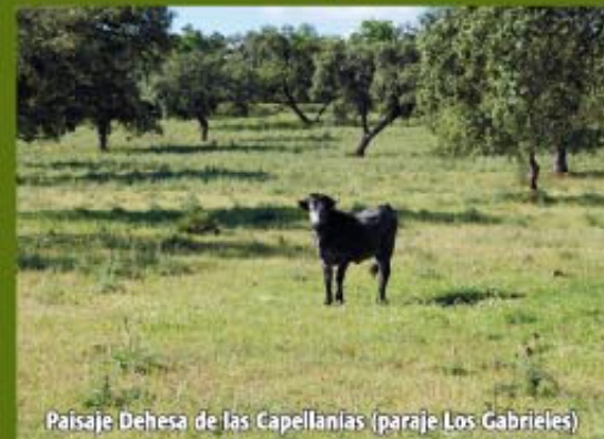
Paisaje Dehesa de las Capellanías (paraje Los Gabrieles)

Seguimos por un sendero paralelo a la carretera, tras la valla protectora del arcén izquierdo, y a unos 250 m llegamos a un camino (Pto. 3-2 Coord. 29S X=699661 Y=4160012), frente a la Fuente del Bercillo, manantial de