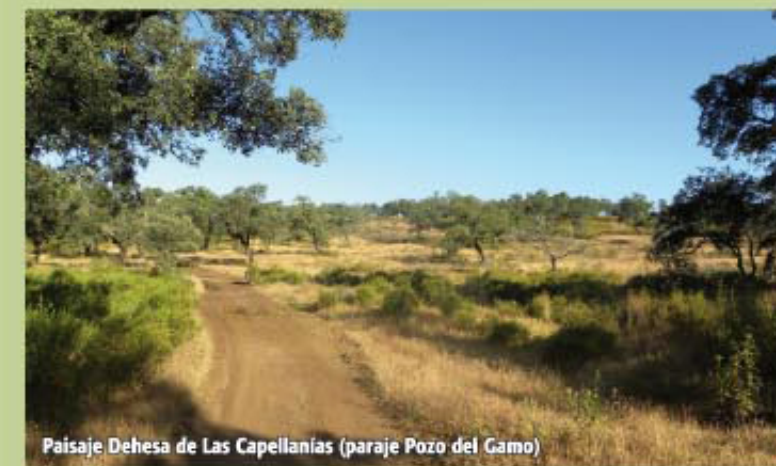
Paisaje Dehesa de Las Capellanías (paraje Pozo del Gamo)

Seguimos paralelamente a la carretera en dirección La Palma del Condado, durante unos 700 m, por un sendero junto al arcén derecho hasta tomar un carril que continúa inicialmente la misma dirección y que poco a poco comienza a separarse de la carretera llevándonos, al cabo de unos 650 m,