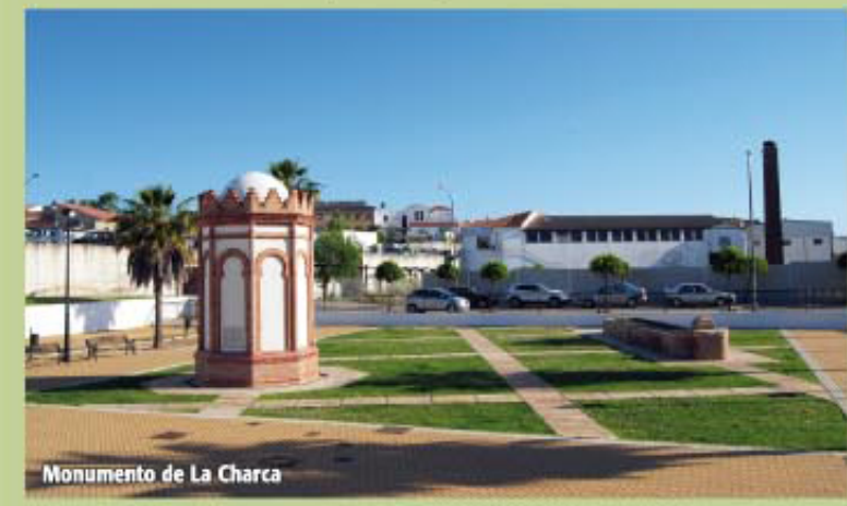
Monumento de La Charca

Bajamos una pequeña cuesta, hasta pasar por un lavadero de áridos que desemboca en el antiguo trazado del ferrocarril del Buitrón, hoy día convertido en Vía Verde (Pto. 3-6 Coord. 29S X=699412 Y=4159680) y que tomándola hacia la derecha nos llevará a la Barriada del Rollo, donde se encuentra el Monumento de La Charca, punto de partida.