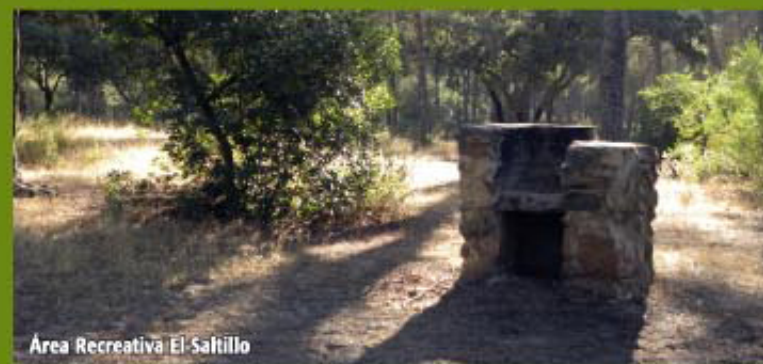
Área Recreativa El Saltillo

Continuando por el camino de regreso al Aula de la Naturaleza observamos multitud de chalets y parcelas particulares hasta llegar al Monte Público municipal El Saltillo, conocido en la zona como "Pinar del Estado", donde existen ejemplares centenarios de pino piñonero de gran porte, conjugado con un Área Recreativa con juegos múltiples para niños, bancos, mesas, papeleras, barbacoas, fuentes y servicios.