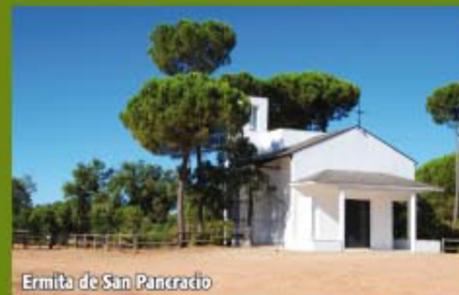
Ermita de San Pancracio

Continuando el camino, algo más adelante, alcanzamos el cruce con el camino público de Navahermosa (Pto. 12-5 Coord. 29S X=695659 Y=4153933). Lo tomamos a la izquierda dirección Norte, durante 300 m, donde cogemos otro a la derecha y en el siguiente cruce a la izquierda. A escasos 200 m observamos la Ermita de San Pancracio, paraje de celebración de la Romería de los Valverdeños cada primavera y lugar idóneo para realizar una parada y reponer fuerzas en su zona de descanso con mesas, bancos y papeleras.