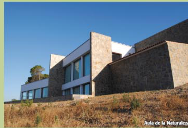
Aula de la Naturaleza