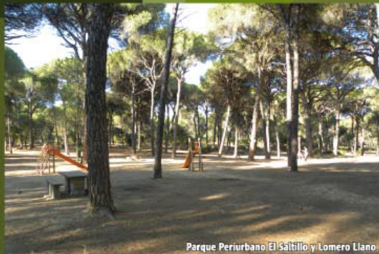
Parque Periurbano El Saltillo y Lomero Llano

SALIDA: Aula de la Naturaleza. LLEGADA: Aula de la Naturaleza. RECORRIDO: 11 km. DURACIÓN: 2 horas 15 minutos. MODALIDAD: A Pie, Bicicleta y Caballo. GRADO DE DIFICULTAD: Baja. RECOMENDACIONES: Disponer de calzado adecuado y agua potable. ELEMENTOS DE INTERÉS: Parque Periurbano El Saltillo y Lomero Llano, con sus dos áreas Recreativas de "El Saltillo" y "Los Toscones", Aula de la Naturaleza, Vía Verde y la Ermita de San Pancracio.