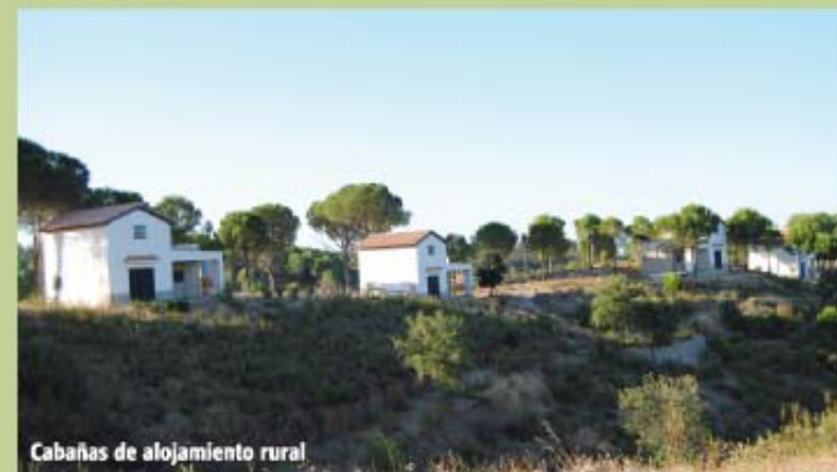
Cabañas de alojamiento rural

El camino continúa paralelo a una fila de chalets privados pertenecientes a la urbanización de Los Pinos, hasta cruzarnos con el camino público de Las Gamonosas, el cual tomamos a la derecha durante escasos 80 m, para posteriormente desplazarnos a la izquierda por un nuevo camino, en el que recorridos 500 m, llegamos a un cruce de dos direcciones. Si continuamos de frente nos dirigiremos al Área Recreativa Los Toscones, y si giramos a la derecha, descenderemos dirección al muro del pantano Los Toscones, a continuación las Cabañas de Alojamiento Rural y acto seguido el Aula de la Naturaleza.