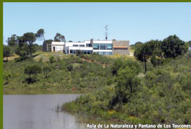
Aula de La Naturaleza y Pantano de Los Toscones

Resaltamos que gran parte de ésta ruta transcurre por el interior del Parque Periurbano El Saltillo y Lomero Llano, Espacio Natural Protegido declarado en junio de 1999 por la Consejería de Medio Ambiente, con una extensión de 188,5 ha. Su vegetación principal arbórea se compone del pino piñonero, la encina y el alcornoque, con una cobertura arbustiva típica de matorral noble mediterráneo formada principalmente por jaras, jaguarzos, mirtos, lentiscos, madroños, olivillas y romeros. Y donde existe una gran riqueza faunística representada por zorros, turones, tejones, lirón careto, mirlo, rabilargo, milano negro, ratonero, gavián, etc.