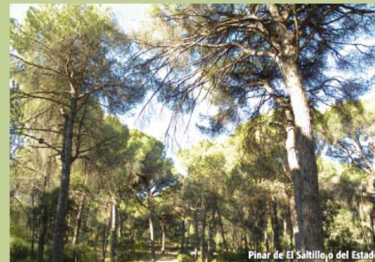
Pinar de El Saltillo o del Estado

El camino continúa paralelo a una fila de chalets privados pertenecientes a la urbanización de Los Pinos, hasta cruzarnos con el camino público de Las Gamonosas, el cual tomamos a la derecha durante escasos 80 m, para posteriormente desplazarnos a la izquierda por un nuevo camino, en el que recorridos 500 m, llegamos a un cruce de dos direcciones. Si continuamos de frente nos dirigiremos al Área Recreativa Los Toscones, y si giramos a la derecha, descenderemos dirección al muro del pantano Los Toscones, a continuación las Cabañas de Alojamiento Rural y acto seguido el Aula de la Naturaleza.