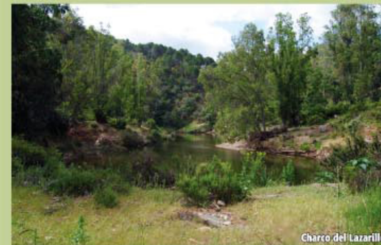
Charco del Lazarillo

Más adelante, el sendero asciende por un terraplén de piedras sueltas llegando a un carril que tomamos a la derecha a la altura de los Charcos de la Corte, separado del Charco del Lazarillo por el cortafuego de la Vistosa.