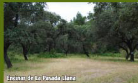
Encinar de La Pasada Llana

Continuando por dicho camino, de cómodo recorrido, a unos 2 km, pasaremos por una cancela metálica que nos indica el inicio de la finca La Plata, la cual cruzamos y algo más adelante pasamos junto a su Cortijo, continuando por una constante bajada hasta la cancela de salida, próxima a la Rivera de Casas de Valverde.