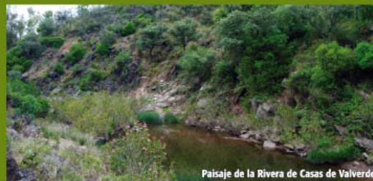
Paisaje de la Rivera de Casas de Valverde

A lo largo del recorrido, por el sendero paralelo a la Rivera, observamos inicialmente una gran explanada recta conocida como "Vega de las Cabras". Casi al final de ésta desemboca por la izquierda el Barranco de la Higuera. A partir de aquí, y hasta un cortafuego próximo, toda la ladera derecha es