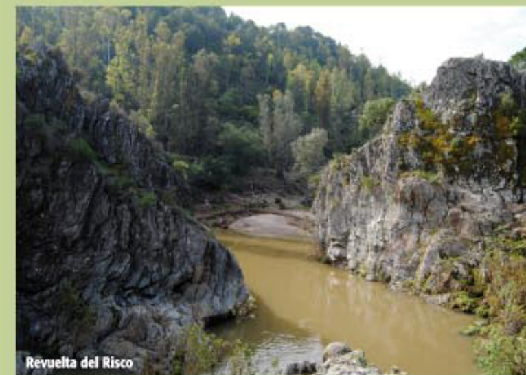
Revuelta del Risco

A continuación, a la izquierda, apreciamos el Barranco del Castillejo hasta un nuevo cruce de carriles, donde tomamos nuevamente el de la derecha junto a un pinar y frente al Barranco del Alamillo. Atravesamos la Rivera por un puente de hormigón, a unos 350 m, antes de comenzar el ascenso hacia la Pista General del Manzanito, existe un cruce de pistas (Pto. 4-3 Coord. 29S X=707620 Y=4158820), y desplazándonos unos 300 m a la izquierda observamos la Revuelta y Charco del Risco, paraje de gran belleza y muy emblemático para los lugareños.