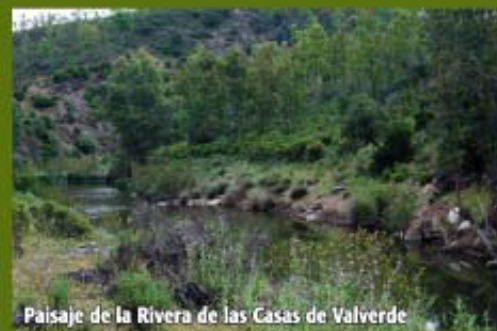
Paisaje de la Rivera de las Casas de Valverde

Volvemos a cruzar el cauce pasando al margen derecho, siguiendo paralelo al mismo a través de un sendero de gran belleza que en ocasiones nos obligará atravesar de una orilla a otra según convenga.