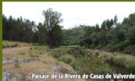
Paisaje de la Rivera de Casas de Valverde

Una vez en el margen izquierdo de la Rivera aguas abajo, continuamos por un carril junto a una alamedada, donde podemos observar, a escasos metros, el Charco de los Calaeros, y algo más adelante un pinar, donde se encuentran las ruinas de la Casa del Melo. Nuevamente llegaremos a la Rivera, sin haber visto una amplia revuelta de la misma, donde se encuentra el Charco de la Barza.