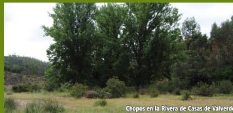
Chopos en la Rivera de Casas de Valverde

En las aguas de la Rivera son frecuentes las bogas, barbos y galápagos. Se observan también garzas reales, patos salvajes, cormoranes y pollitas de agua. Además, no es raro encontrar en sus orillas ciervos, jabalíes, zorros y meloncillos o sus huellas.