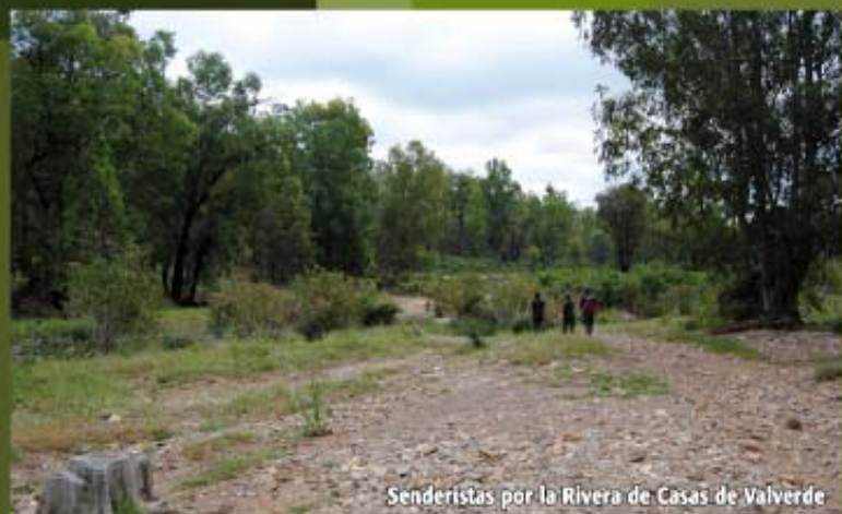
Senderistas por la Rivera de Casas de Valverde

SALIDA: Campo Municipal de Tiro al Plato