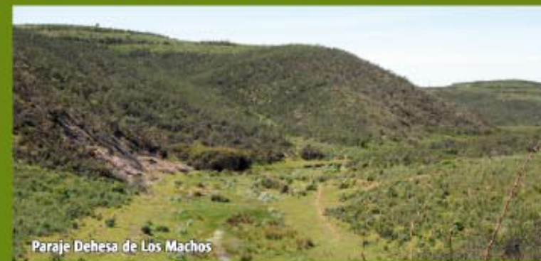
Paraje Dehesa de Los Machos

Continuamos el camino por medio de la repoblación de encinas y alcornoques hasta atravesar el arroyo del Buitrón, (Pto. 5-5 Coord. 295 X=700377 Y=4162819) donde giramos a la izquierda y llegamos al Dique de Los Silillos, circunvalándolo por un camino paralelo durante 1.200 m.