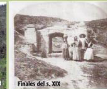
Finales del s. XIX

Volviendo a la carretera recorreremos escasos 60 m y volvemos a desplazarnos a la derecha por un pequeño sendero que nos conduce a la Fuente Bajohondo la cual se conserva en buen estado. Nuevamente en la carretera continuamos otros 50 m y en la misma vaguada de la derecha a unos 70 m se encuentra otro manantial parcialmente soterrado denominado Fuente Cristina.