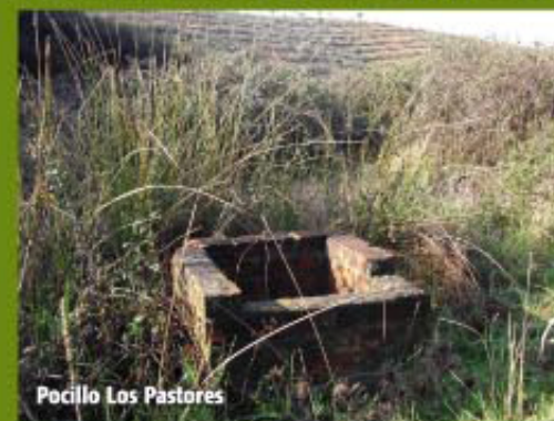
Pocillo Los Pastores

Al cabo de 1.400 m el camino hace un giro hacia el Sur y se introduce nuevamente en la Dehesa de Los Machos a través de un paso canadiense, donde se encuentra el Pocillo Los Pastores (Pto. 5-4 Coord. 295 X=701181 Y=4163993) y comienza el camino en ligera ascensión durante 200 m y justo antes de culminarla debemos desplazarnos a la derecha hacia el arroyo para observar a unos 40 m la Fuente Los Pastores, parcialmente soterrada con zarzas.