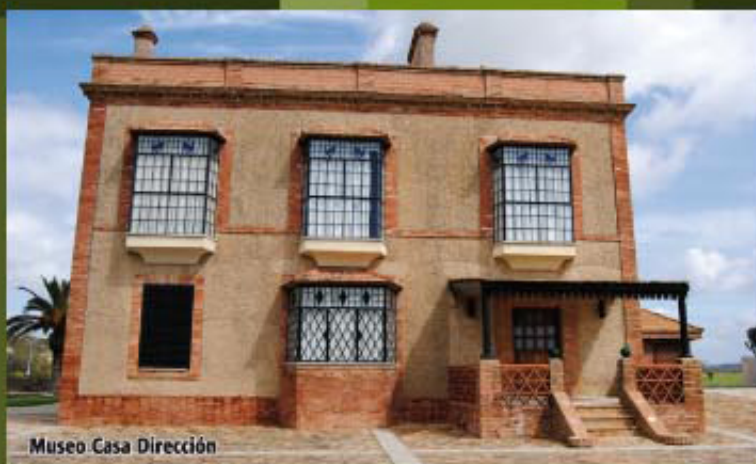
Museo Casa Dirección

SALIDA: Casa Dirección. LLEGADA: Casa Dirección. RECORRIDO: 11 km. DURACIÓN: 2 horas 30 minutos. MODALIDAD: A Pie, Bicicleta y Caballo. GRADO DE DIFICULTAD: Baja. RECOMENDACIONES: Hay que cruzar en varias ocasiones cursos de agua y se recomienda hacer la ruta en primavera-verano o época de poca lluvia. ELEMENTOS DE INTERÉS: Varias Fuentes naturales, tramo de Camino Romano, Dique de Los Silillos, paraje Dehesa de Los Machos y Museo Casa Dirección.