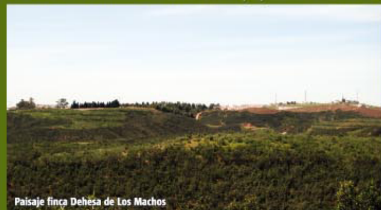
Paisaje finca Dehesa de Los Machos

Partimos en coche desde el Aula de la Naturaleza tomando la N-435 dirección Valverde del Camino, y dentro de la Población nos dirigimos al Museo Casa Dirección (Pto. 5-1 Coord. 295 X=698636 Y=4161823), donde estacionamos el vehículo e iniciaremos la ruta a pie. Comenzamos nuestra andadura dirección Norte por la antigua Vía del Ferrocarril Buitrón-San Juan del Puerto hoy día convertida en camino rural y que en tiempo transportaba el mineral de varias minas al Norte de Valverde hasta el Muelle del Tinto en la capital de Huelva. Introduciéndonos en la finca Dehesa de Los Machos de 923 Has, propiedad de la Comunidad