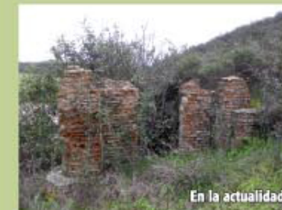
En la actualidad