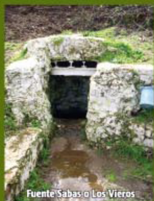
Fuente Sabas o Los Vieros

Nuevamente volvemos a la antigua vía del ferrocarril y la continuamos hasta llegar a dos arcos y a escasos metros la Fuente Sabas o Los Vieros la cual se encuentra muy bien conservada por los propios vecinos de Valverde que aún hacen uso de la misma (Pto. 5-2 Coord. 295 X=699619 Y=4162689).