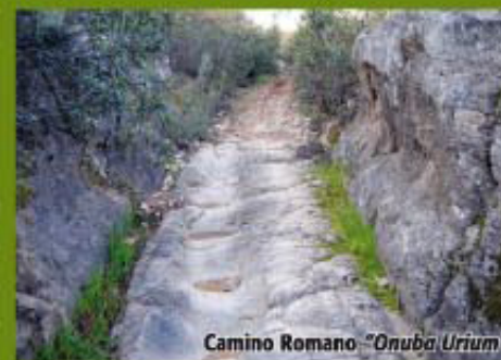
Camino Romano "Onuba Urium"

A otros 400 m cabe estar atento porque dejaremos el camino para girar a la derecha y tomar un sendero ligeramente ascendente que nos conducirá a un tramo del antiguo Camino Romano "Onuba Urium" siglo HV (Pto. 5-3 Coord. 295 X=699561 Y=4163277), utilizado para el transporte del mineral de Riotinto hasta Huelva, tramo de terreno firme pizarroso bien conservado donde todavía son visibles las huellas que han dejado los carruajes en forma de profundos surcos.