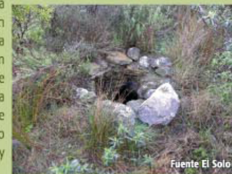
Fuente El Solo

Justo donde el camino comienza a separarse del Dique y antes de comenzar una subida, (Pto. 5-6 Coord. 295 X=700471 Y=4162816) hay que desplazarse a la derecha por la misma vaguada unos 75 m para encontrar la Fuente Castilla parcialmente soterrada con zarzas y continuando la misma vaguada otros 300 m a mano derecha retirada de ésta unos 40 m y junto a una pequeña vaguada se encuentra la Fuente El Solo que se conserva en muy buen estado.