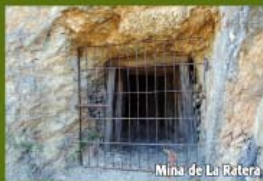
Mina de La Ratera

A unos 500 m del huerto cruzamos la Rivera de Las Mateas ( Pto. 2-3 Coord. 29S X=702739 Y=4162359 ), próximo a la antigua Mina de La Ratera, con aguas de tonalidades cobrizas y anaranjadas, donde podemos encontrar la Erica andevalensis (especie en peligro de extinción).