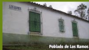
Poblado de Los Ramos

En caso de no querer tomar la alternativa descrita en el párrafo anterior, continuamos por el mismo camino que traemos, dejando la Mina de Ratera a la derecha, observando a continuación un pozo y a escasa distancia un cruce de caminos, donde tenemos la posibilidad de tomar el de la derecha, ida y vuelta, para observar a unos 200 m el antiguo Poblado forestal de Los Ramos, del que se observan aún varios edificios en pie y que poseía en tiempo una torreta