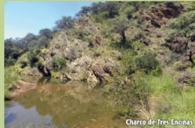
Charco de Tres Encinas

De vuelta en el carril general de "Guijarro", comenzaremos múltiples subidas y bajadas entre encinas y alcornoques, observando antiguas zahúrdas de ganado, pozos, pantanetas, etc. hasta alcanzar el badén de hormigón sobre la Rivera de Las Mateas ( Pto. 2-7 Coord. 29S X=702556 Y=4160588 ), lugar de encuentro con la primera alternativa de recorrido. Continuamos el camino y observaremos a la izquierda, entre la arboleda, el cortijo de la finca, después un pozo y a continuación llegamos al Barranco de Los Pajares, donde existe la posibilidad