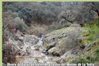
Rivera de Casas de Valverde y restos del Molino de La Tejita

de observar a escasos 200 m aguas abajo, mediante un tramo de ida y vuelta, los restos del Molino de La Tejita, en la Rivera de Casas de Valverde.