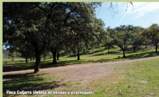
Finca Guijarro (dehesa de encinas y alcornoques)