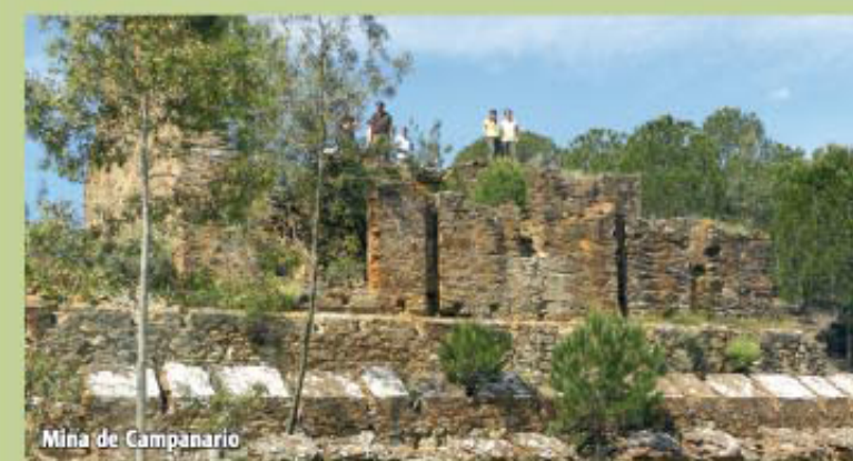
Mina de Campanario

Pasada la Corta Descamisada, el camino inicia un descenso, cruza un arroyo de agua ácida conocido por los lugareños como "Barranco Agrio" procedente