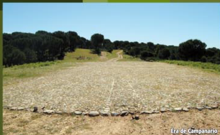
Era de Campanario