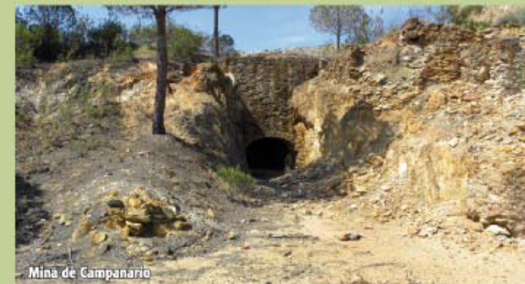
Mina de Campanario

de la mina y a unos 350 m se observa a la derecha el Risco Mojarro, otro afloramiento rocoso de gran envergadura y explotado también en tiempos por la minería (observando unos metros más adelante el socavón de su explotación).