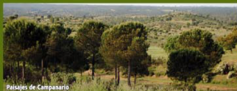
Paisajes de Campanario

Cruzamos la carretera y proseguimos por un camino, que a 1.200 m se une al antiguo ramal ferroviario Mina Campanario-El Cuervo, que cogemos a la derecha, y al cabo de otros 1.600 m observaremos a nuestra izquierda la Casa de Las Colmenas, junto a una esquina de alambrada (Pto. 7-5 Coord. 29S X=692198 Y=4156896).