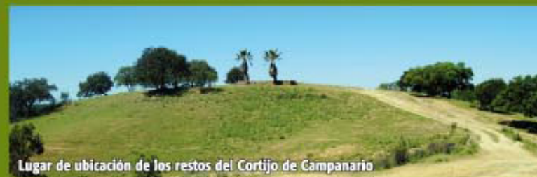
Lugar de ubicación de los restos del Cortijo de Campanario

Retirados unos 200 m de la casa y dirección Este, se encuentra una "Era" antigua y tradicional de gran tamaño construida en piedra que se utilizaba antiguamente para trillar el cereal con la ayuda de caballos y mulos.