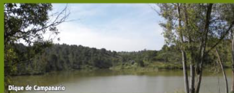
Dique de Campanario

Regresando a la anterior bifurcación (Pto. 7-6 Coord. 29S X=691738 Y=4156555) tomamos ahora el camino de la derecha hasta encontrar en un